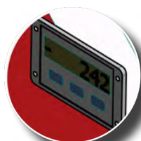
Cyfrowy wyświetlacz głębokości wiercenia