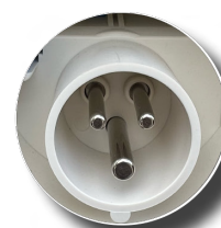
Port szybkiego ładowania