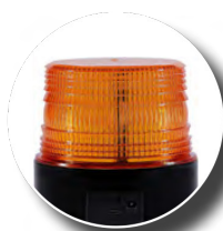
Lampa ostrzegawcza LED