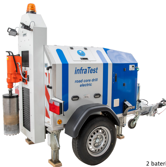
2 baterie zapewniające 6 godzin ciągłej pracy