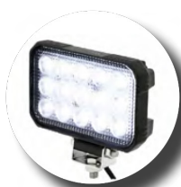
Światła robocze LED